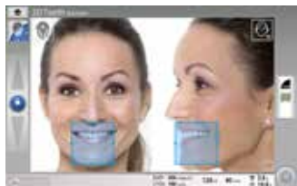
Interfaz gráfica del usuario